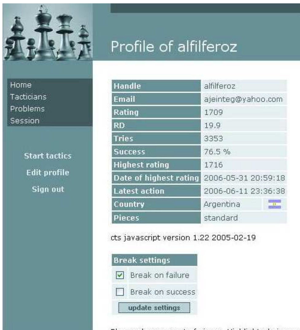
Figura 4: Los datos de tu cuenta en el servidor CTS

Ya de nuevo en la pantalla principal del sistema, ingresa tus credenciales. En " Handle " indica tu nombre o alias y en Password , la clave que recibiste por email. Luego haz clic en el botón Sign In .