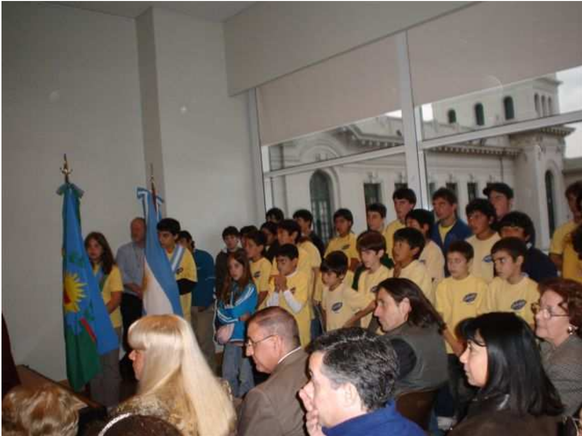
Alumnos de la Escuela Roberto Grau, de San Andres de Giles