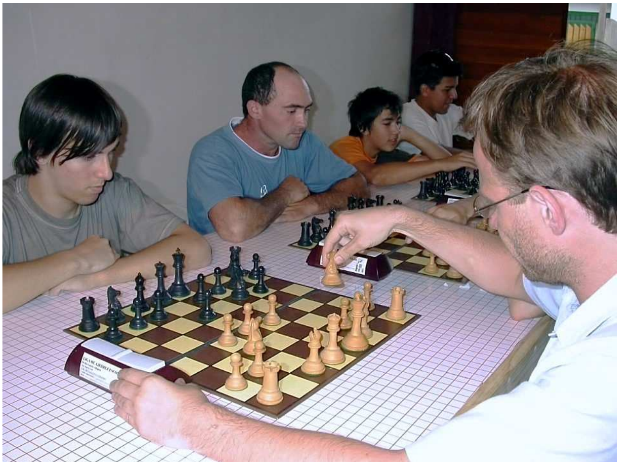
Jugadores, padre y directivo en el torneo de partidas rápidas

En el transcurso de la jornada se compartió un almuerzo entre jugadores y directivos, partidas a la ciega con el profesor Yvón y a la finalización de los dos torneos se realizó un certamen de partidas rápidas a 5 minutos, donde se sumaron jugadores, padres y directivos presentes.